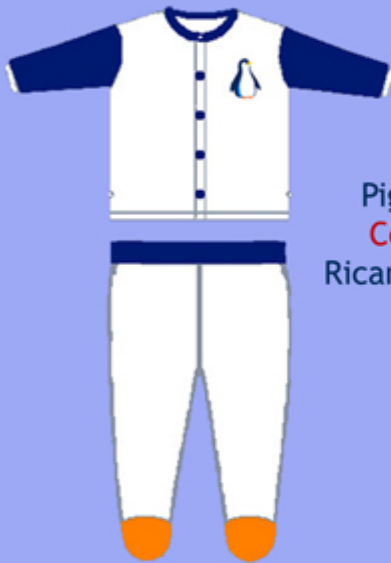
Pigiama - 0 - 12 mesi Cotone PIMA andino Ricamato - Colori Naturali

La linea per proteggere i bimbi da 0 a 12 mesi