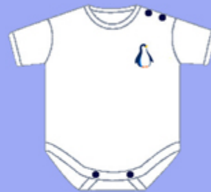
Body - 0 - 12 mesi Cotone PIMA andino Ricamato - Colori Naturali